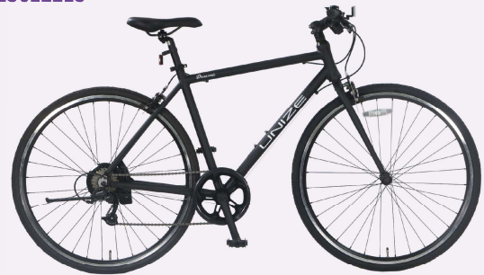
#102 / ツヤケシブラック JAN: 4938915612192