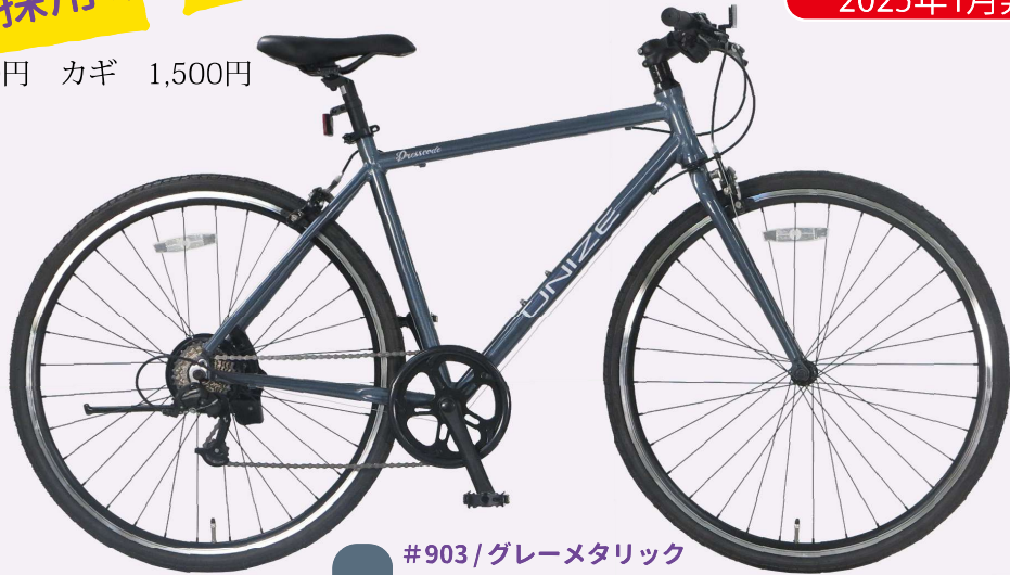
#903 / グレーメタリック JAN:4938915612215