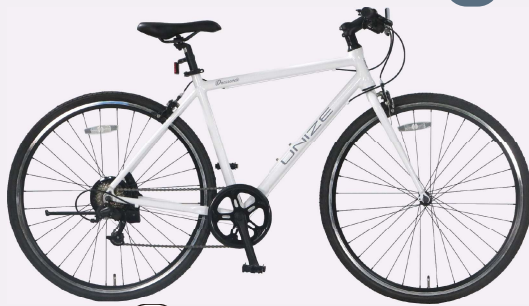
#506 / パールホワイト JAN:4938915612208